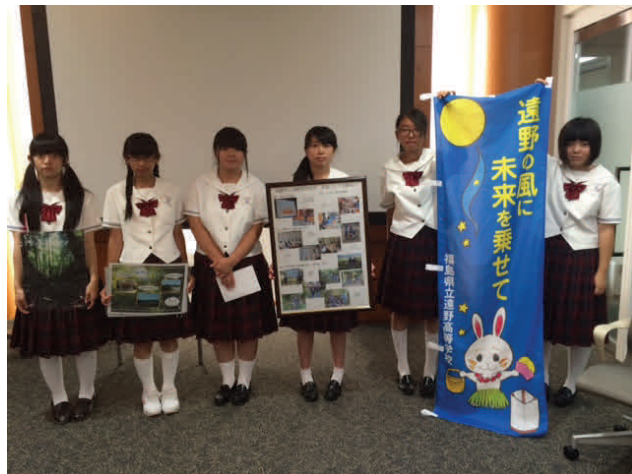
Fukushima Student Delegation Visit to U.S. Embassy Tokyo, August 17, 2015

For more information on internship opportunities with CS Japan, please visit us here .