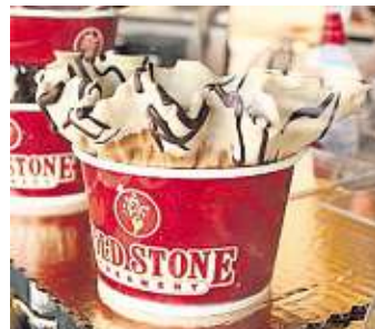
BRZY V ČESKU Zmrzliná Cold Stone má v Česku stát kolem stokrúny za porci.

Cold Stone Creamery má v celkem pětadvaceti zemích světa kolem 1500 provozoven. Česko by mohlo být základnou značky pro